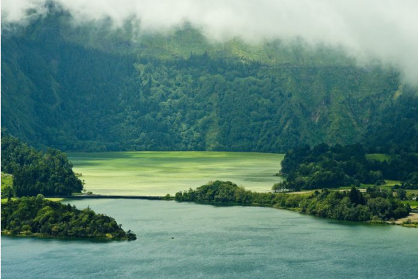
Azores Islas Sete Cidades