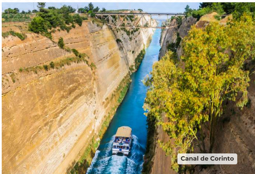
Canal de Corinto