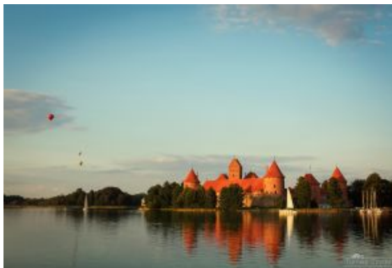
Castillo de Trakai