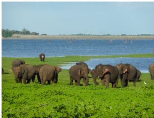
Mineriya National Park