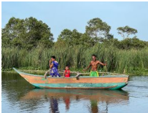
Laguna de Kalametiya