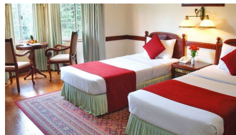
Hotel Grand, Nuwara Eliya