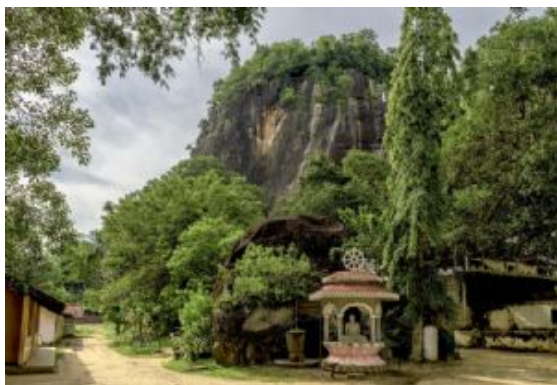
Mulgirigala Rock Temple